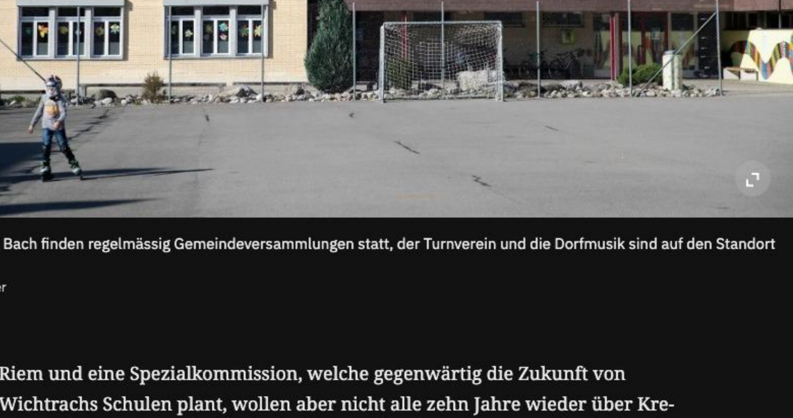
Im Schulhaus am Bach finden regelmässig Gemeindeversammlungen statt, der Turnverein und die Dorfmusik sind auf den Standort angewiesen.

Mal waren es neue Brandmelder, mal war es eine neue Heizung. Die dazugehörige Mehrzweckhalle erfüllt einige feuerpolizeiliche Standards nicht mehr. Aber auch das wäre zu beheben. Riem: «Keine grosse Sache.»